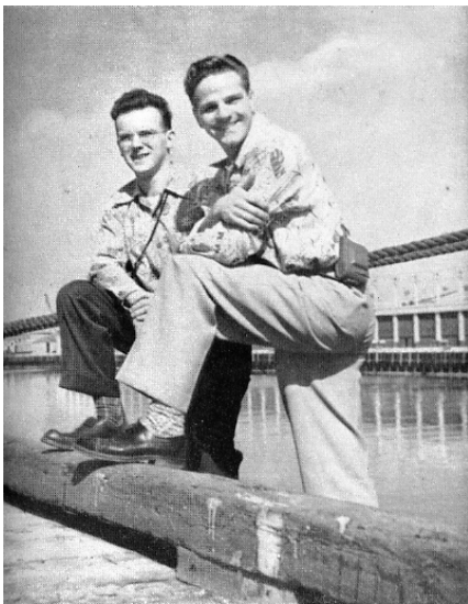
Jim Elliot e Peter Fleming em 1952

No verão de 1950, depois dum encontro com um missionário que estava no Equador e que o informou das necessidades daquela região, Jim percebeu com maior clareza que deveria ir para lá. Os seus pais interrogaram, juntamente com outros, se o ministério do Jim não seria mais frutuoso nos Estados Unidos onde tantas pessoas ignoram ainda a verdadeira mensagem do Evangelho. Ele respondeu: “Não consigo ficar no meu país enquanto os Quichuas perecem. Que importa se as igrejas repletas da minha terra não estão avivadas? Elas têm as Escrituras, Moisés e os profetas, e muito mais ainda. A condenação delas está escrita nos seus livros de cheques e no pó que recobre as suas Bíblias.”