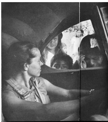
Elisabeth Elliot, após a notícia

Quando regressaram a Palm Beach, tinham descoberto 4 corpos; o quinto tinha sido avistado pouco antes mas foi impossível reencontrá-lo nas águas abaixo. A equipa de salvamento sepultou os corpos debaixo da árvore onde os missionários tinham instalado a casa.